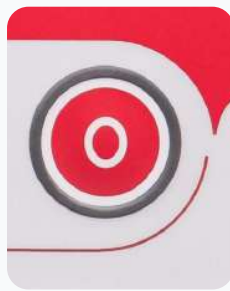
Botão de parar operação