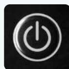
Botão de Ligar e Desligar