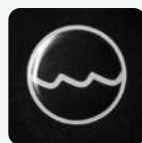
Botão de Lavagem