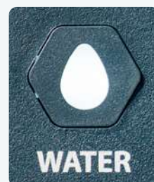
Botão de acionar água