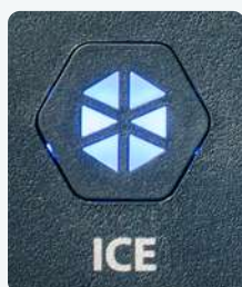
Botão de acionar gelo