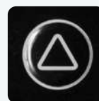
Botão de Verificar